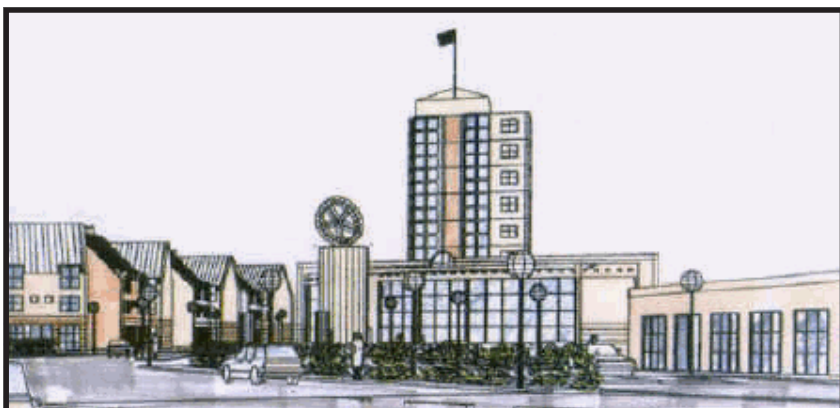
Sådan forestiller arkitekterne sig, at silområdet kan udbygges, så hele området fremstår som et stort, attraktivt IT-vækstcenter.

partnere, der kan hjælpe dem. Det kan eksempelvis være uddannelsesinstitutioner, konsulenter og så videre. Vi kan lige så godt udnytte de muligheder og kompetencer, der allerede ligger i regionen – til fælles glæde.